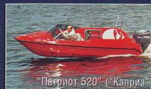
"Патриот 520" ("Каприз")