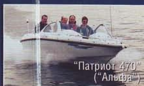
"Патриот 470" ("Альфа")