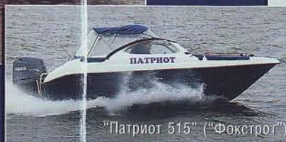
"Патриот 515" ("Фоксгрот")

● Оборудование "Glaas Craft", материалы "Scott Bader", "Neste", "Reichhold"