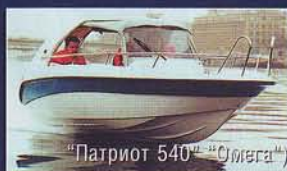
"Патриот 540" ("Омега")

● Импортные моторы (новые и second hand) с установкой и гарантией