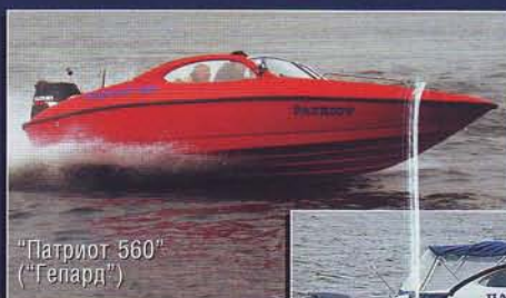
"Патриот 560" ("Гепард")

Катера "Патриот" Из стеклопластика от производителя