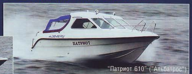
"Патриот 610" ("Альбатрос")

● Оборудование "Glaas Craft", материалы "Scott Bader", "Neste", "Reichhold"