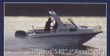
"Патриот 540" ("Авангард")

ООО "Патриот", Московская обл., Ногинский р-н, г. Электроугли, Сафоновский пер., 5.